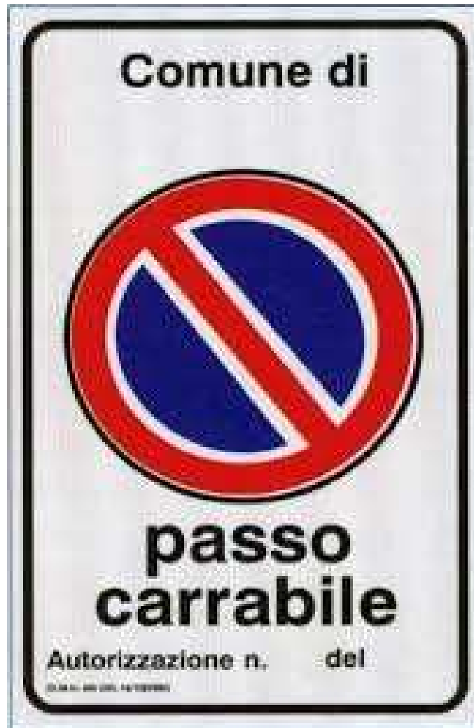
Fig. II 78 - Art. 120 comma 1°lett. e) Reg. Att.ne del Codice della Strada